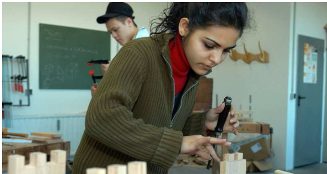
Almanya ZIB'deki Dezavantajlı Genç Öğrenci

Alman okuldan işe geçiş süreci; pratik becerilerin bir şirkette işyerinde kazanıldığı ve teorinin eğitim kurumlarında öğretildiği "dual (ikili) çıraklık eğitimi sistemi" olarak bilinir. Zorunlu genel eğitimi bitirdikten sonra, genç insanların çoğunluğu mesleki becerileri öğrenmek ve sonrasında iş piyasasına girmek için bir şirkette çıraklık eğitimine başlarlar. Çıraklık eğitimleri, örgün eğitim sisteminin parçasıdır ve genç öğrencileri topluma ve iş piyasasına dahil etmeye yardım eder.