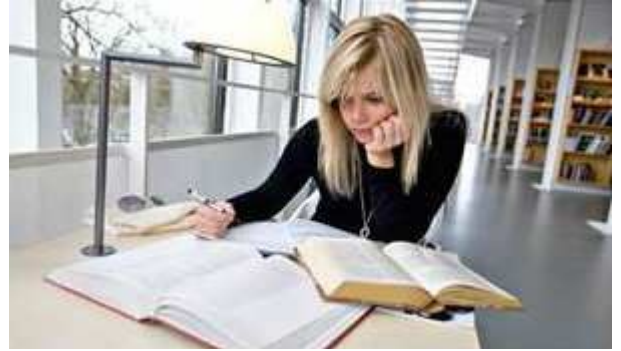
İsveç CFL'de genç öğrenci

Ayrıca, ulusal kurumsal ortama bakmaksızın, aynı zorlukla her yerde karşılaşılmak zorundadır: dezavantajlı genç insanlarla sürdürülebilir öğrenme başarısı meydana getirmek için teori öğrenmeyi ve uygulamalı eğitimi etkin bir şekilde nasıl birleştirilir?