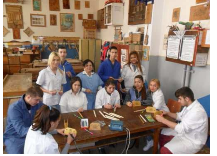
Romanya Grigore Moisil Meslek Lisesinde Genç Öğrenciler

-Tecrübenin paylaşımı ve geçiş süreciyle ilgili olarak en iyi uygulamaların yayımlanması.