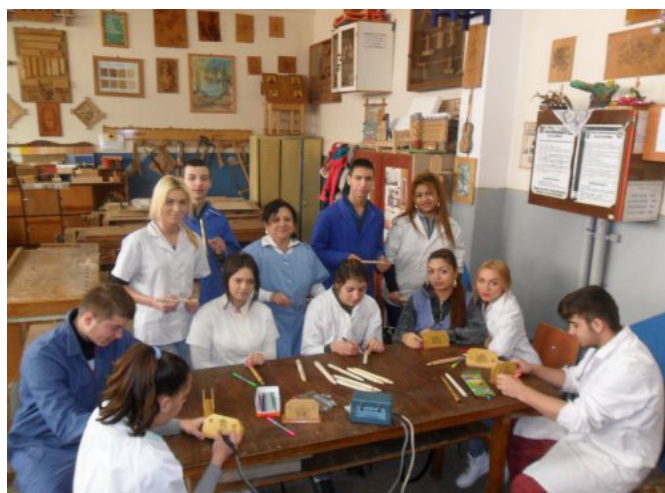
Ученици в Grigore Moisil, Професионално училище, Румъния