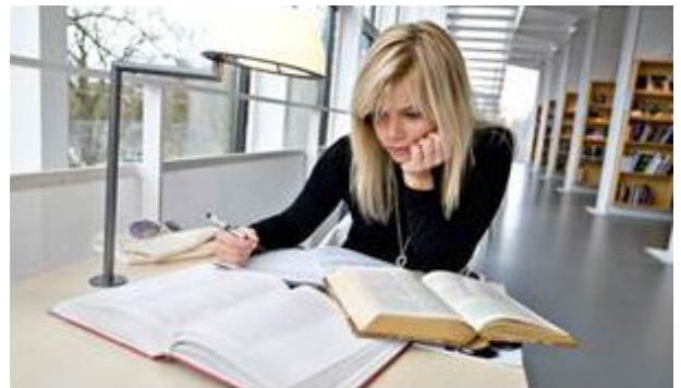
Обучаема в CFL, Швеция

Това е подходът, който проектът „Обучение в работна среда“ следва: Целта е да се проучи различният опит на учене чрез работа в европейските страни, да се открие, кое функционира добре и да се идентифицират и разпространяват добри практики.